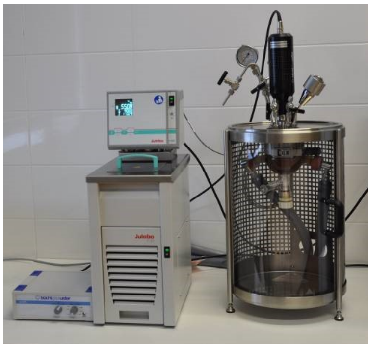
Reakční autokláv (Büchiglas Uster)

Benzene hydrogenation under autoclaving conditions