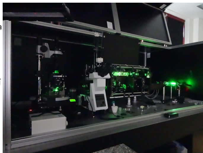
Systém AFM-Raman, (NT-MDT, Rusko) s Upright and Invertovanou optickou AFM konfigurací